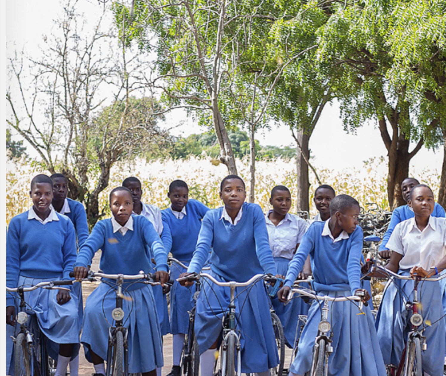
Première sortie à vélo à la Didia Secondary School dans la région de Shinyanga, en Tanzanie.

71 % des élèves gagnent au moins une heure par jour grâce au vélo.