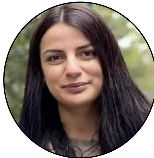
Hürriyet Aydin Praktikantin Supply Management