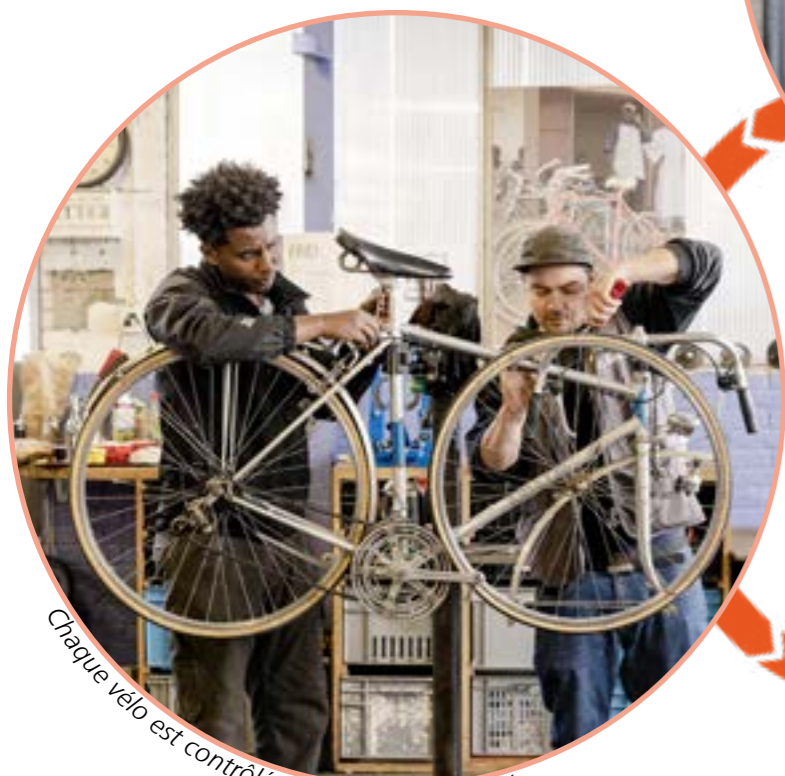
Chaque vélo est contrôlé et, si possible, réparé.

Velafrica peut compter sur un large réseau: 34 entreprises d'insertion sociale et professionnelle et les institutions dans l'exécution des mesures, sont impliquées dans le traitement des vélos donnés. Grâce à leur travail, plus de 50 conteneurs peuvent être exportés par an.