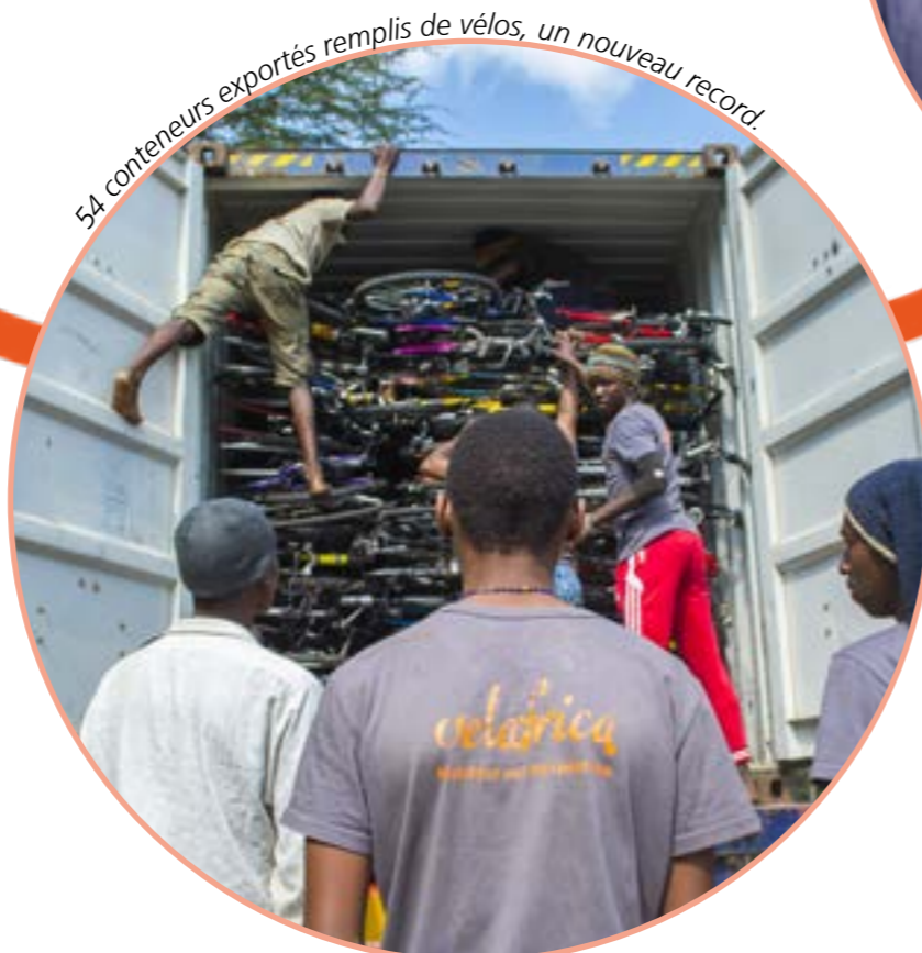
54 conteneurs exportés remplis de vélos, un nouveau record.

Velafrica peut compter sur un large réseau: 34 entreprises d'insertion sociale et professionnelle et les institutions dans l'exécution des mesures, sont impliquées dans le traitement des vélos donnés. Grâce à leur travail, plus de 50 conteneurs peuvent être exportés par an.