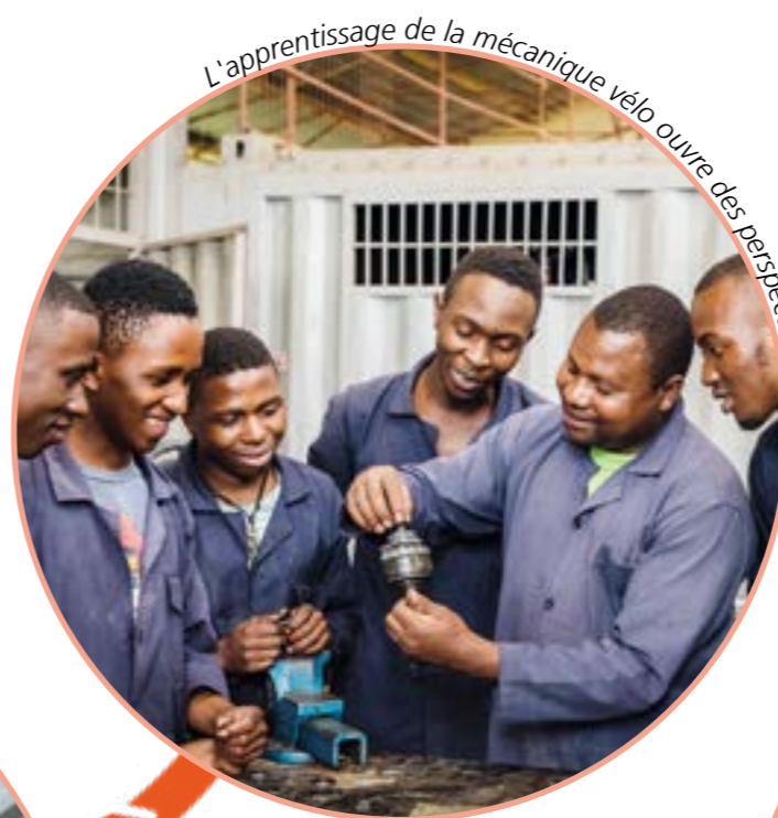
L'apprentissage de la mécanique vélo ouvre des perspectives de vie.

Au Burkina Faso, Velafrica a fait un bond en avant en mettant en place un programme de formation professionnelle en vélo-mécanique reconnu au niveau national. Dans un premier temps, les enseignants sont formés par notre formateur Däni Grüter selon l'approche «Train the Trainers» et les 243 premiers apprentis commencent leur formation.