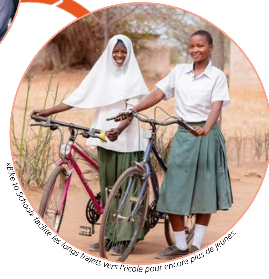
«Bike to School» facilite les longs trajets vers l'école pour encore plus de jeunes.

Les enfants en Afrique subsaharienne marchent souvent jusqu'à deux heures pour se rendre à l'école et sont exposés à de nombreux dangers. Il y a déjà 4035 écoliers ayant un long chemin de l'école, qui reçoivent un vélo à prix très réduit grâce à notre programme «Bike to School». Cela leur fait gagner plus d'une heure par jour.