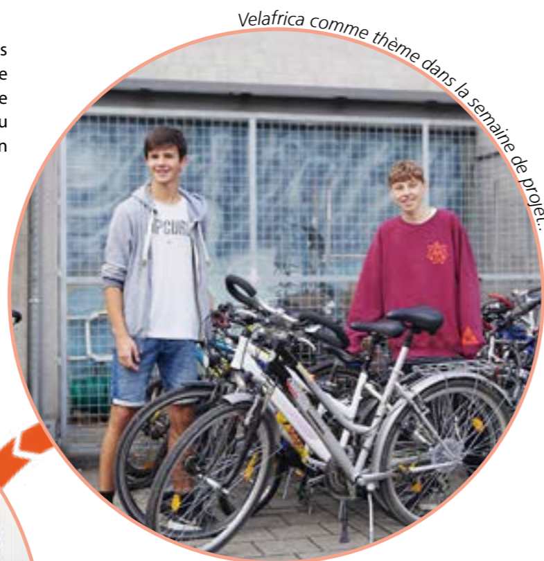
Velafrica comme thème dans la semaine de projet.

Au début de la chaîne d'impact de Velafrica se trouvent les vélos donnés. Les bénévoles ont organisé 64 collectes de vélos dans toute la Suisse en 2021. Par exemple par une classe du lycée de Soleure. Sur les 36 987 vélos collectés au total en Suisse, ils en ont contribué 277, plus un don en espèces provenant de leur vente de pâtisseries.